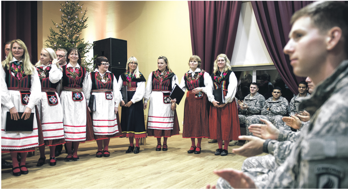
Kihelkonna segakoori imetlesid 5. detsembril NATO sõdurid Ameerikast, kes ajateenija kannatlikkusega eestlaste n-õ oma asja Kihelkonna kultuurimajas pealt vaatasid. Sinna kanti tõi neid Kaitseliidu suurõppus Orkaan 2014.